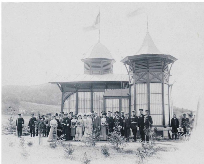
Слика 2: Краљ Александар и краљица Драга са свитом испред Павиљона у Нишкој Бањи 26

Пар дана пре прославе, у граду су се сви ужурбано спремали. Све куће, радње, државна надлештва, школе, касарне су била украшене српским заставама и зеленилом. Нарочито је био уређен центар града, потез од Саборне црквом преко Обреновићеве улице, па све до двора, Трга краља Милана и Тврђаве. Испред Резиденције постављени су зимзелени славолуци, заставе, а видели су се и парадни кораци. Централни догађај је планиран да се одигра у хотелу „Европа” у Вождовој улици. На декорацији хотела ужурбано су радили службеници општине, војници, као и радници железничке радионице. Улаз у хотел је посебно био декорисан. Направљена је имитација капије Нишке тврђаве, поред које су стајала два топа, а унутрашњост је била украшена зеленилом, заставама, оружјем, а у дну сале направљен је престо за краљевски пар. 25